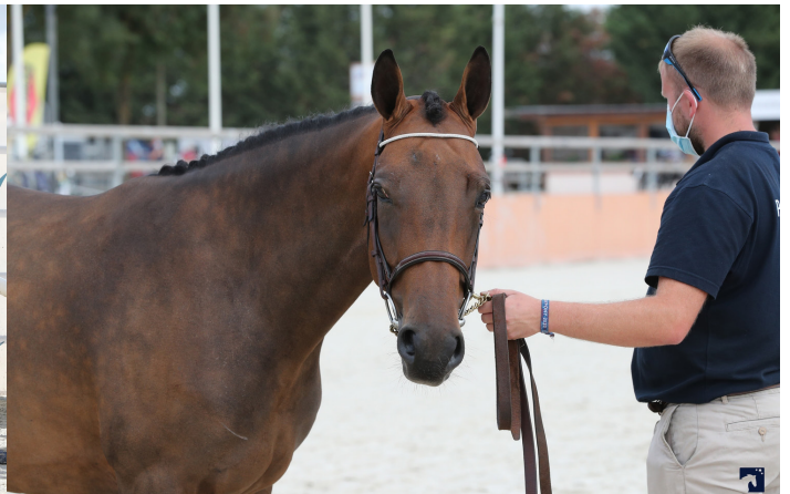
Hashtag Alias à gauche et Henessy de Choc à droite

née chez Miléna Le Guen) obtient la meilleure note de l'épreuve dans l'atelier du modèle et ne démérite pas à l'obstacle avec 16,75 de moyenne. Des bonnes notes qu'elle doit très probablement à sa génétique dont a également profité son propre frère It Boy Alias, sacré champion des mâles de 2 ans cette même année !