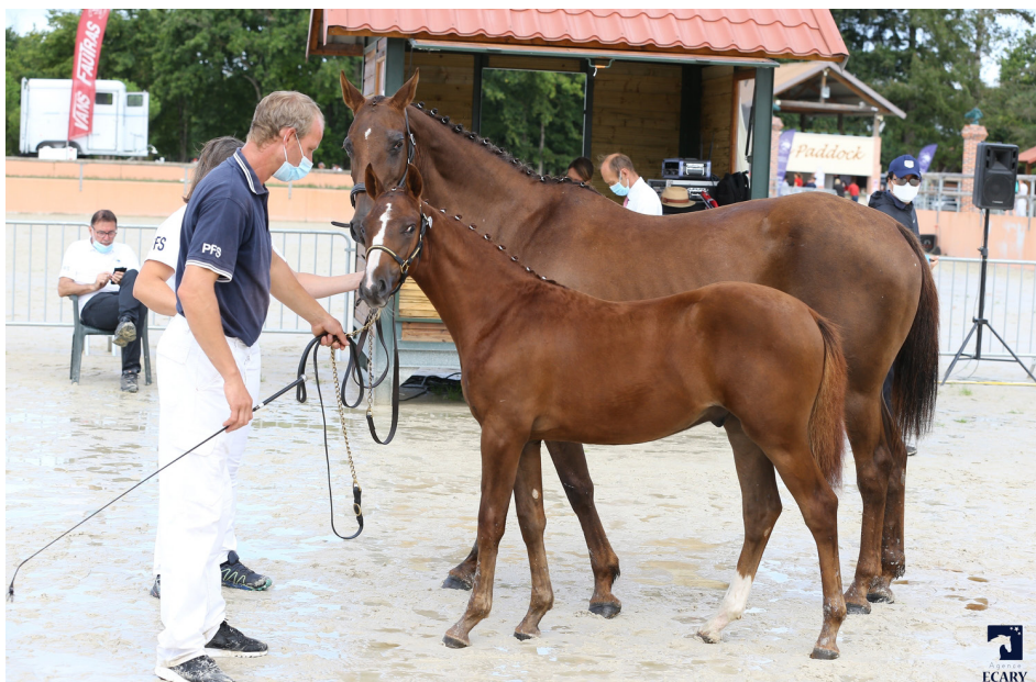
Kif Rislois