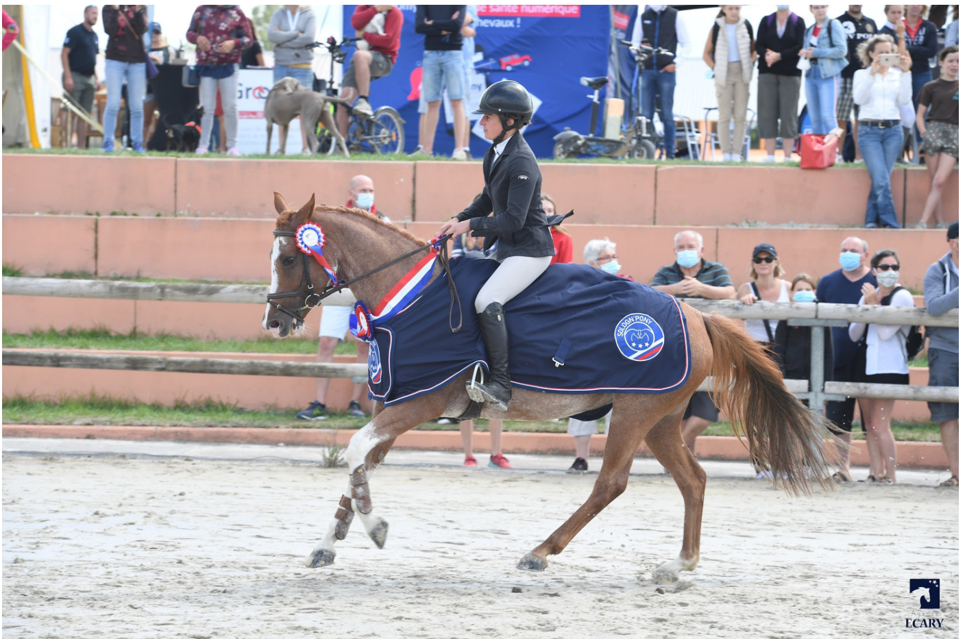
Divine Meniljean

M algré la situation sanitaire, les poneys de 7 ans étaient au rendez-vous pour leur championnat de France Future Elite lors du Sologn'Pony. Cinquante poneys de cette génération des "D" nés en 2013 se sont affrontés lors de cette compétition en trois manches !