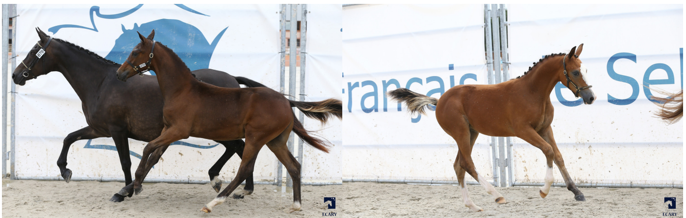
Kracker le Courtal à gauche et Kilkenny Gravière à droite

Enfin avec une moyenne de 15,35, KOUIK DU MAS (Milord des Chouans WD et Orphée de Grevilly PFS par Vazy du Viertot PFS, né chez Simon Canieut) s'octroie la quatorzième place. Le propre frère de sa mère Monty de Grevilly possède un IPO 150, tandis que sa soeur utérine Leda de Grevilly (Syrius de Mai PFS) a produit l'international Sam de Grevilly (Najisco d'Haryns PFS) IPC 130.