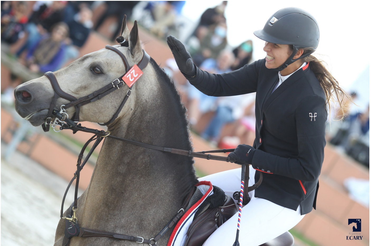
D'Angelo Der Lenn

Pena (Welcome Sympatico HAN) IPO 145 et ancien représentant du programme Jeune Génétique et Della Nocce du Pena (Tricky Choice du Pena PFS) IPO 152.