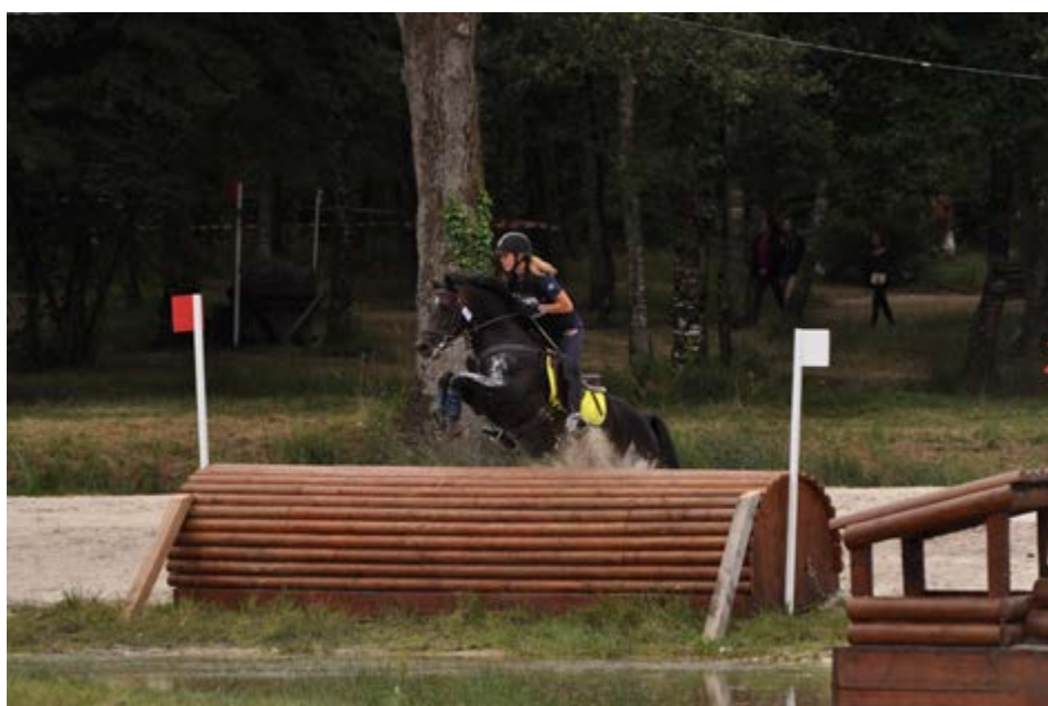
Summer Song d'Aven