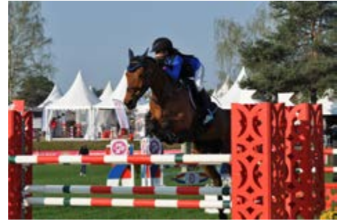
Tutti Quanti Joyeuse (@A. Fontanelle)