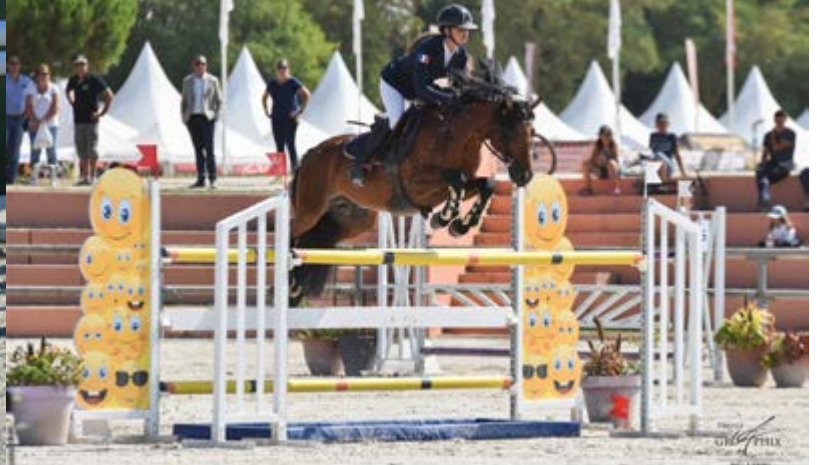
Saphir d'Opale à gauche, S'prit de la Forge en haut à droite et Ushuaia Eliza Modesty en bas à droite