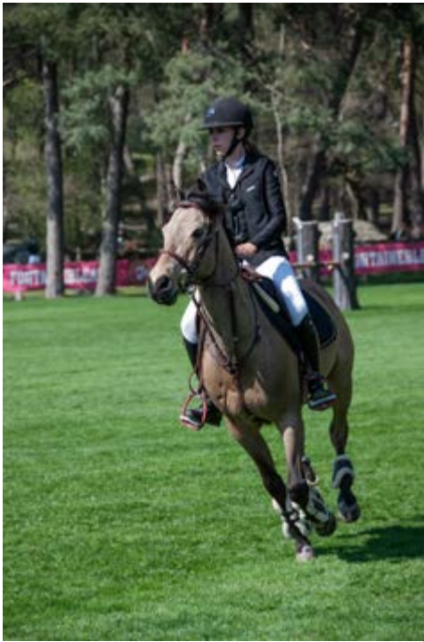
Alidada du Bourg