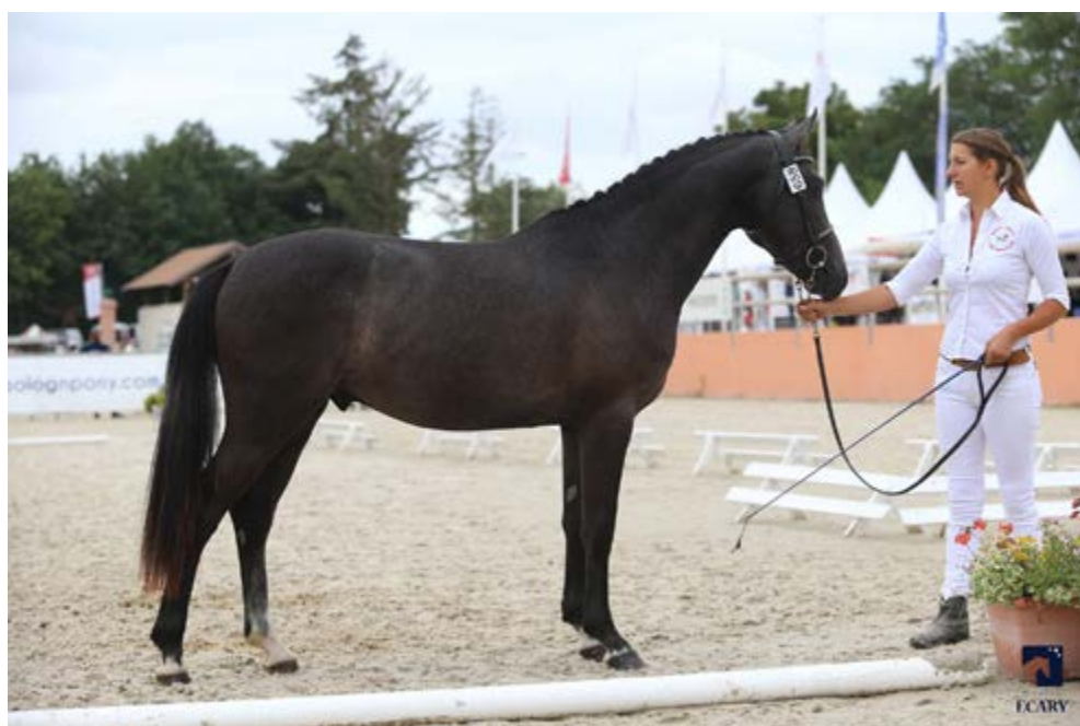
Guernica de Jomat, vice-champion de France des mâles de 2 ans en 2018 et issu d'un croisement cheval - ponette