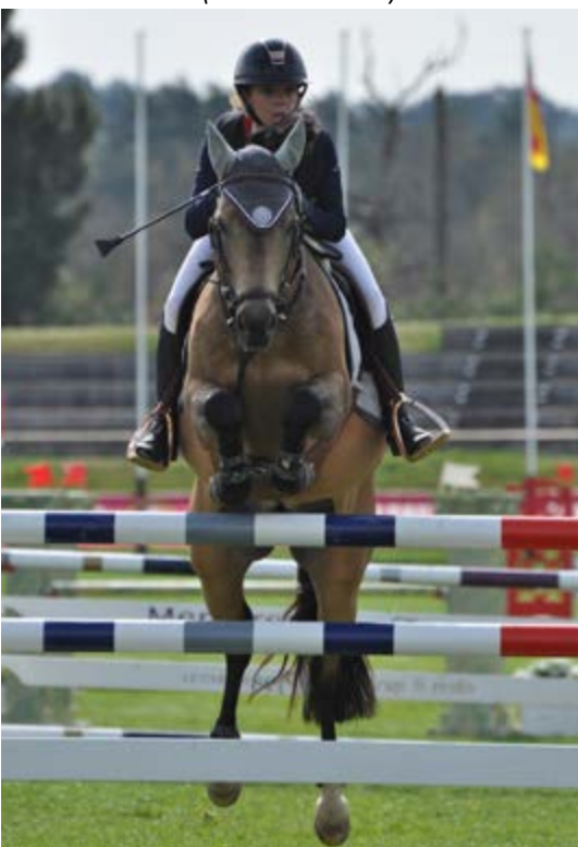
Boticelli de Rohan