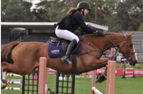
Bonaparte du Thot (@A. Fontanelle)