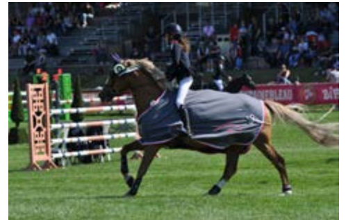
Valiant des Charmes