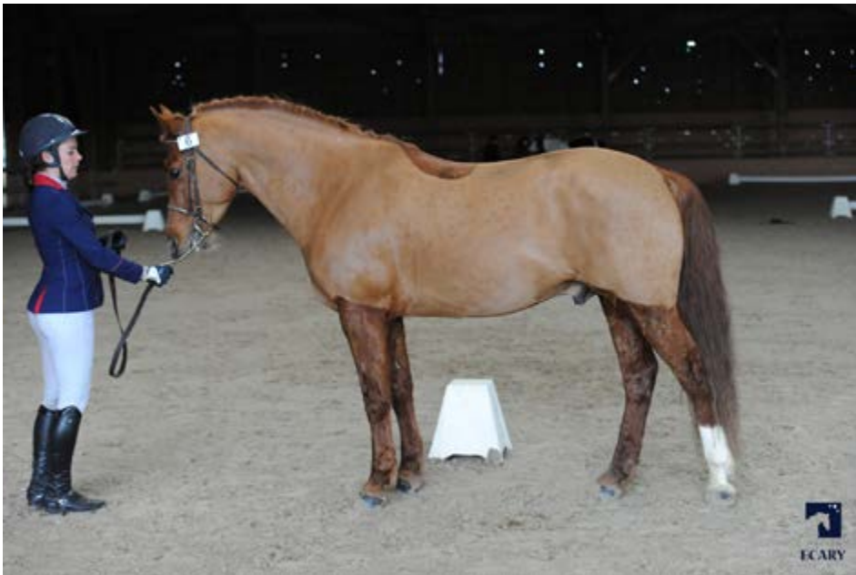
Appy Day des Perchers