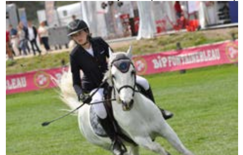
Roudoudou d'Hurl'Vent (@A. Fontanelle)