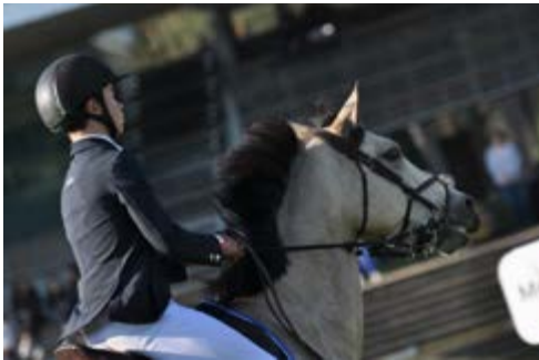
All Best du Rond Pré (@A. Fontanelle)