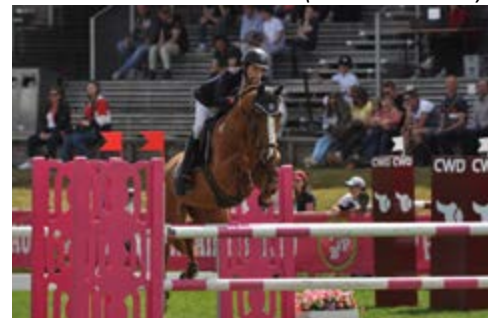
Barabbas du Ponthouar