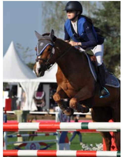
Unoise de Flavigny (@A. Fontanelle)