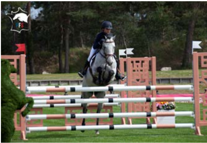
Baluche de la Bauche