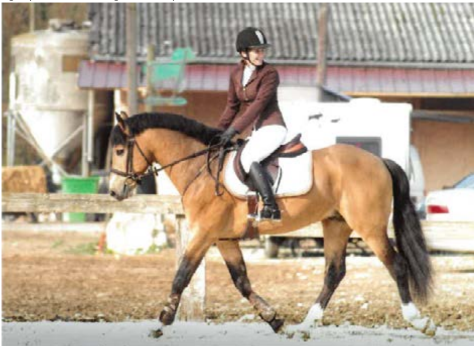
Kaolin II - © Agence Ecary