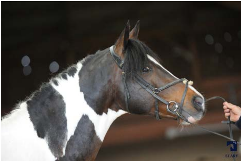
Agility de Caux