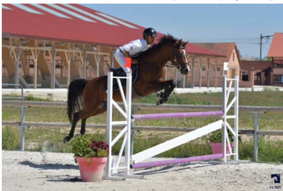
Deluxe d'YI

Deluxe d'YI est très présent sur les terrains de CSO où il se classe fréquemment en As Poney 2D, comme lors de la TDA de Bourg en Bresse où il remporte la vitesse du samedi et se classe 2ème du Grand Prix du dimanche. Son propre frère Best Of d'YI (IPO 148) a entamé sa saison sur les As Poney 1 et les As Poney Elite.