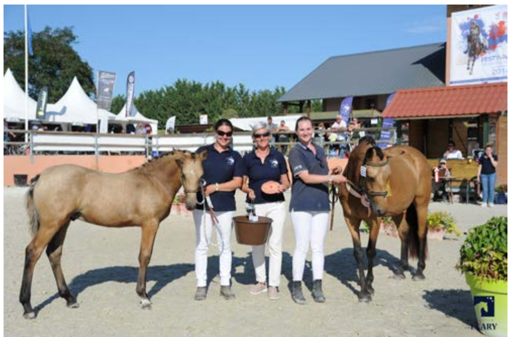
Calamity de Biraval, Connemara Part-bred facteur de PFS, championne de France des poulinières suitées facteur au National PFS 2018

L'ANPFS reste à votre disposition pour répondre à vos questions par mail à contact@anpfs.com ou par téléphone du lundi au vendredi de 9h30 à 16h30 au 02 54 83 72 00.