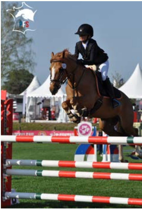
Barbie de Blonde (@A. Fontanelle)