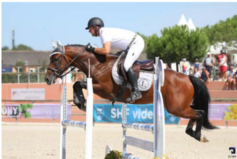
Kasper's Ronaldo