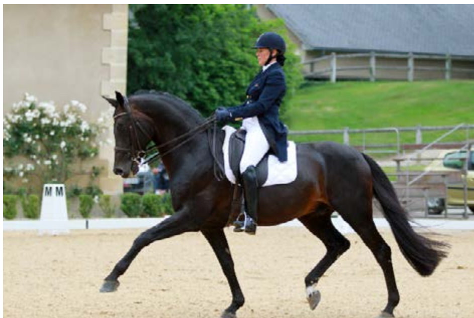
Vito VDL

Primus a été exporté très jeune en République Tchèque et a réalisé de belles performances en épreuves nationales et internationales sous les couleurs tchèques. De retour en France, il se classe dans des épreuves As Poney 2 et As poney 1. Sa lignée maternelle est de bonne qualité, on retrouve dans la production de sa 2ème mère Unbreakable DSA, de bons poneys à l'image de Govern Of Grange (Udou des Etangs NF) – IPO 148 ou Inside de Grange (Cindy de la Dive CO) – IPC 151.