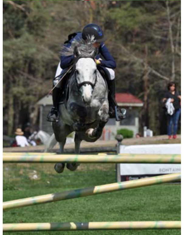
De haut en bas : Champagne d'Ar Cus (©A. Fontanelle), Calgary Der Lenn (©Emma Besnard) et Cogito d'Hurl'Vent (©A. Fontanelle)