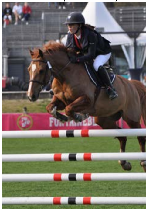
Tibus des Léchères