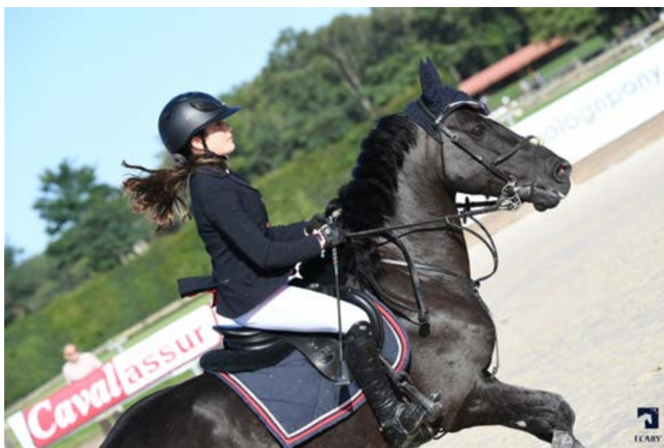
Primus de l'Aube