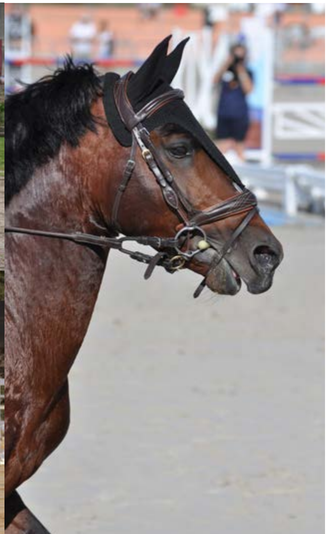
En haut à gauche : Union Jack Kersidal, En bas à gauche : Ungaro Deux Seguret A droite : Un Petit Prince