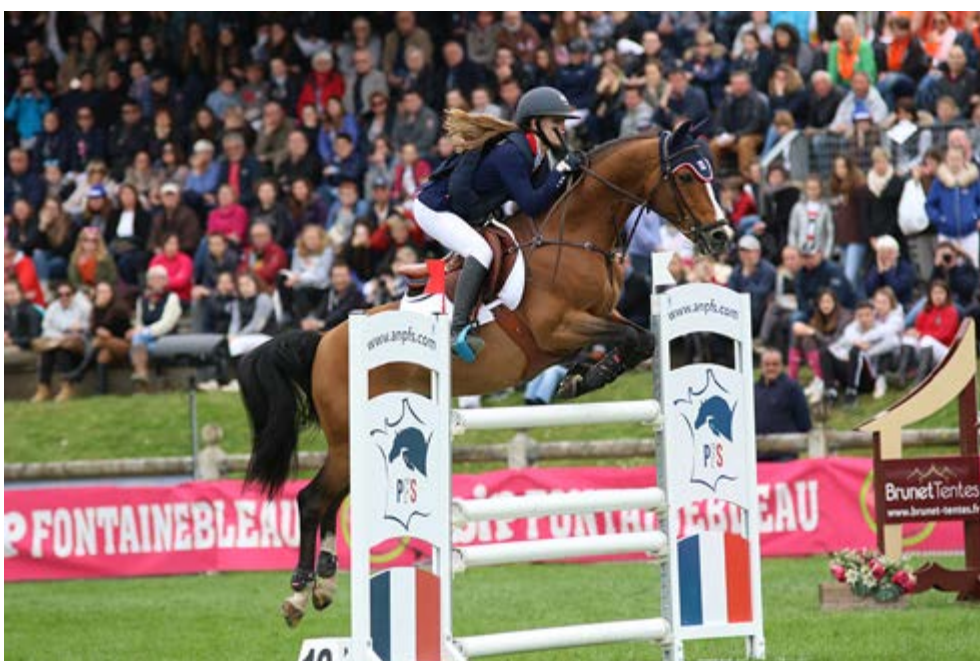
Quabar des Monceaux, inscrit au stud-book Pony Français de Selle à titre initial