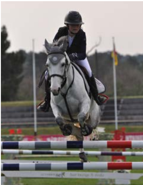
Ulior de Hombourg