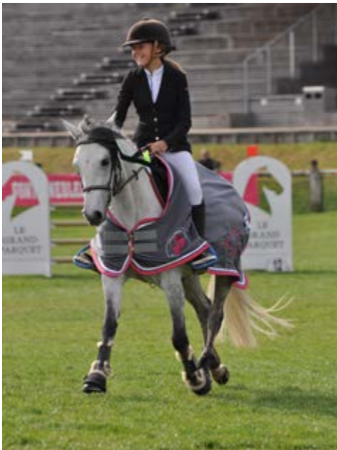
Absolue le Courtal